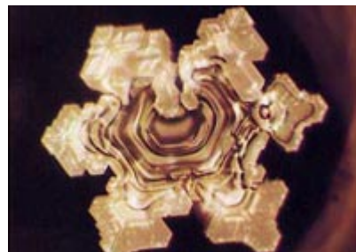
Mozart Sinfonie Nr. 40

Somit hat er bewiesen, dass positive Worte sowie gute Musik – egal ob als Gesang oder Instrument – auch zu einem positiven Wohlbefinden in unserem Körper führen. Und dazu gehört auch die Gospelmusik. Einer meiner langjährigen Träume (habe noch mehrere) hat sich mittlerweile erfüllt. Vor rund 35 Jahren habe ich das letzte Mal in einem Schülerchor gesungen, dann kam der Stimmbruch und es war Schluss. Was mich aber immer wieder fasziniert hat, waren die verschiedenen Gospelchöre, wo nicht nur gesungen, sondern auch getanzt und geklatscht wird. Und irgendwann wollte ich in so einem Gospelchor mitsingen und wurde fündig. Seit mittlerweile 10 Jahren gibt es in meiner Heimatgemeinde Lustenau einen Gospelchor ( www.singring.at ) und ich darf nun seit ein paar Monaten mitsingen.