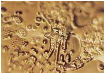
„Du machst mich krank“

Bei Hardrock-Musik entstanden z. B. überhaupt keine Kristalle und bei Klassik-Musik, wie z. B. zu Beethoven oder Mozart entstanden wunderschöne klare Kristalle. Das gleiche entdeckte er auch bei verschiedenen Worten. Wenn man z. B. „du machst mich krank“ aussprach oder das Wort „Danke“ oder „Liebe“.